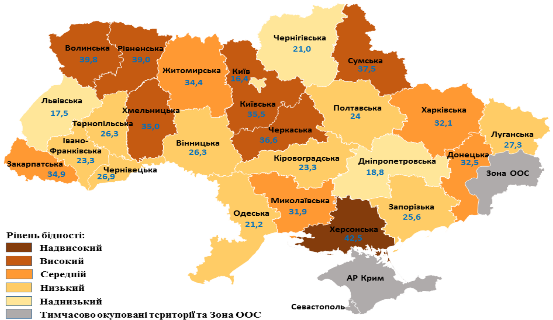
Рис. 2. Рівень бідності за абсолютним критерієм за доходами нижче фактичного прожиткового мінімуму, %