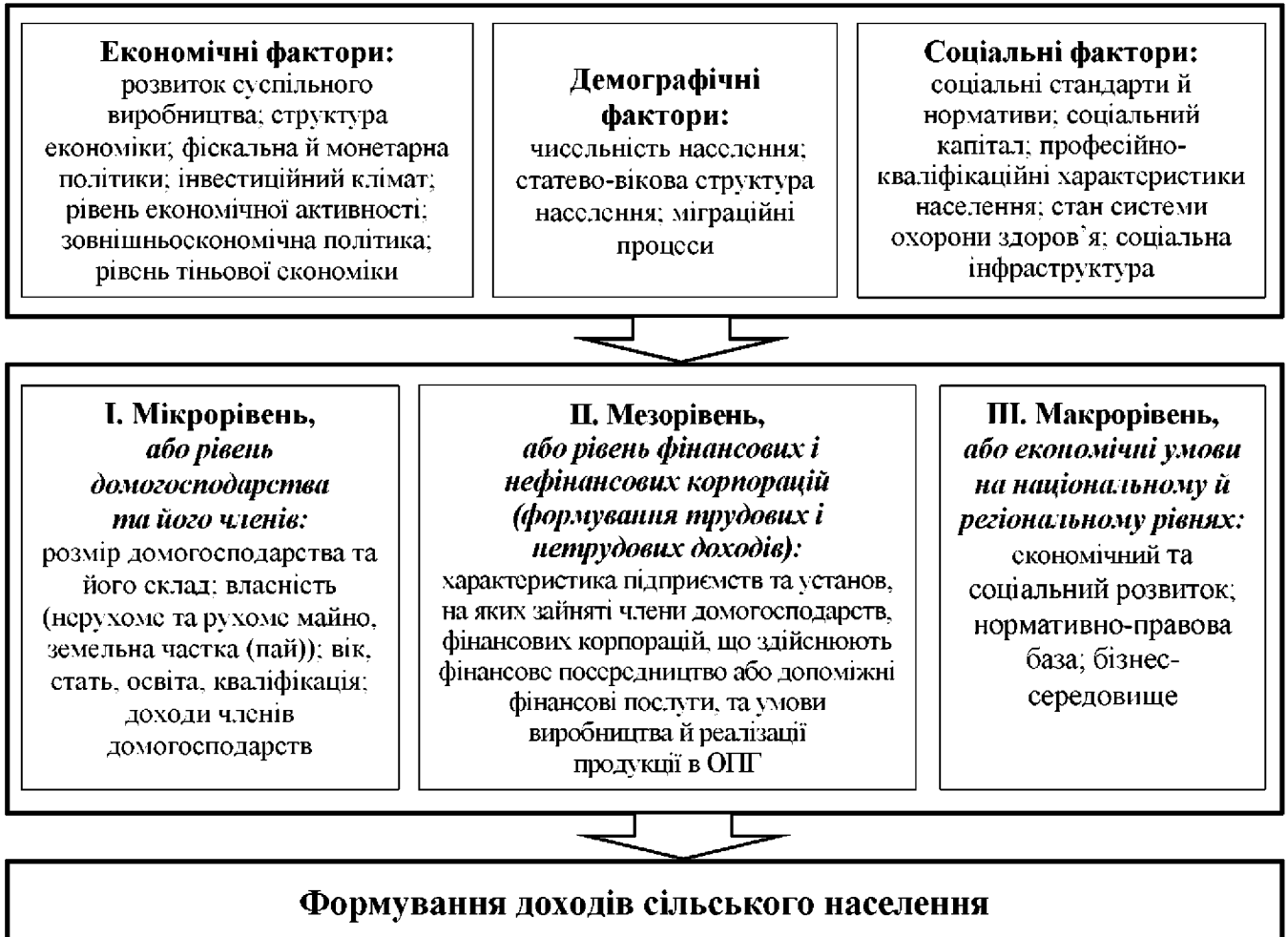
Рис. 1. Рівні та фактори формування доходів сільського населення

В умовах ринкової економіки особливості формування доходів сільського населення та їх рівень значною мірою залежать від індивідуальних і колективних результатів праці, а також від ефективності економіки в цілому. За результатами дослідження виділено три групи факторів і три рівні формування доходів сільського населення, представлені на рис. 1.