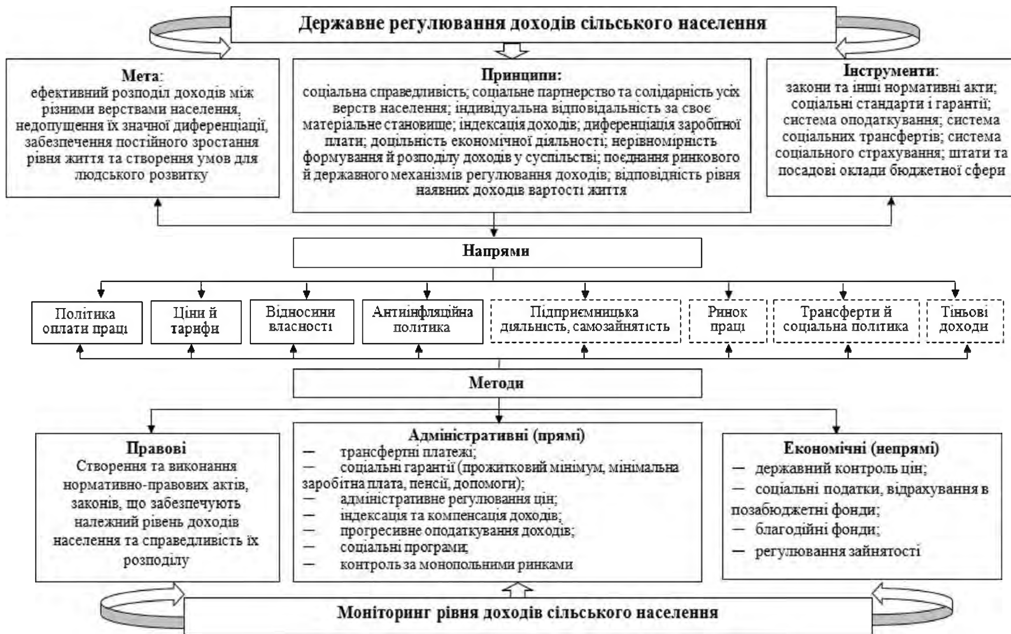
Рис. 4. Схема державного регулювання доходів сільського населення (власна розробка)