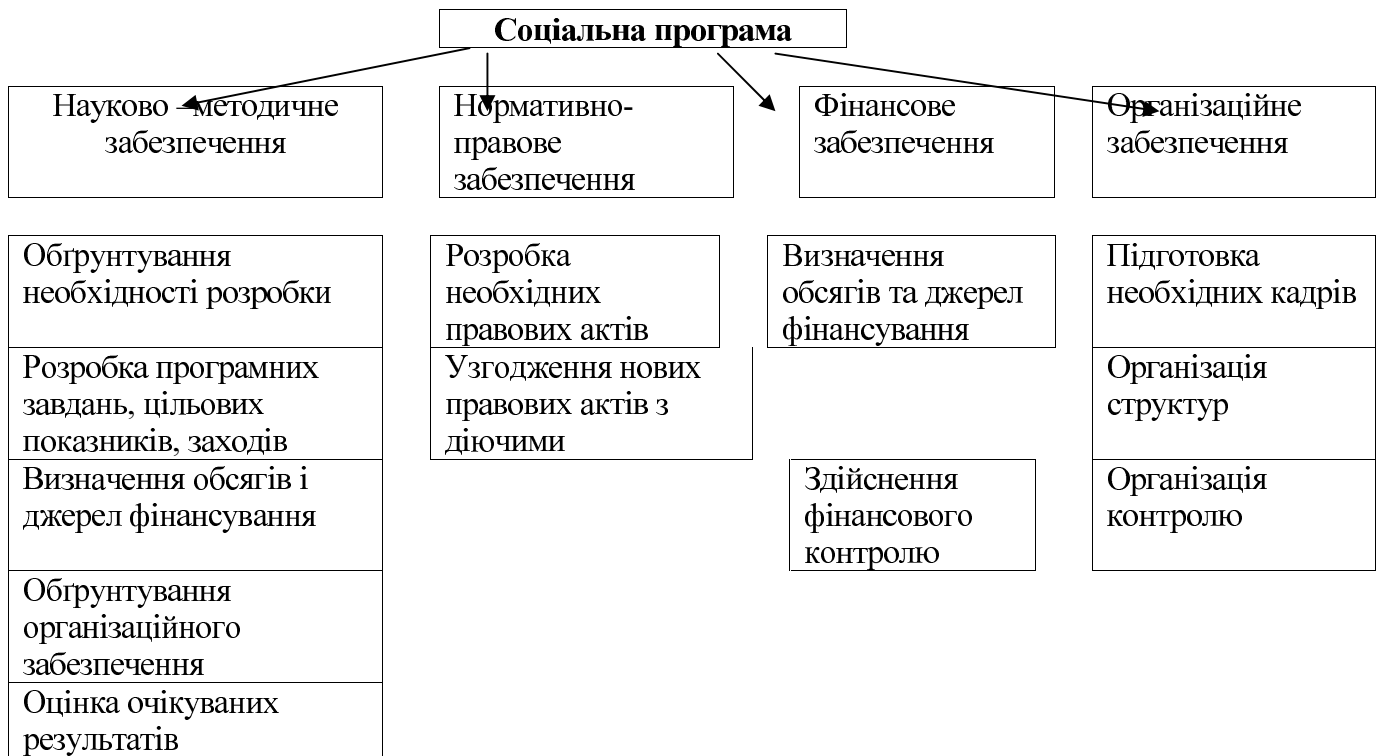
Рис. 2 Загальна структурно-організаційна схема державної соціальної програми

Структурно-організаційна схема являє собою сукупність елементів, що забезпечують дію соціальної програми (рис.2).