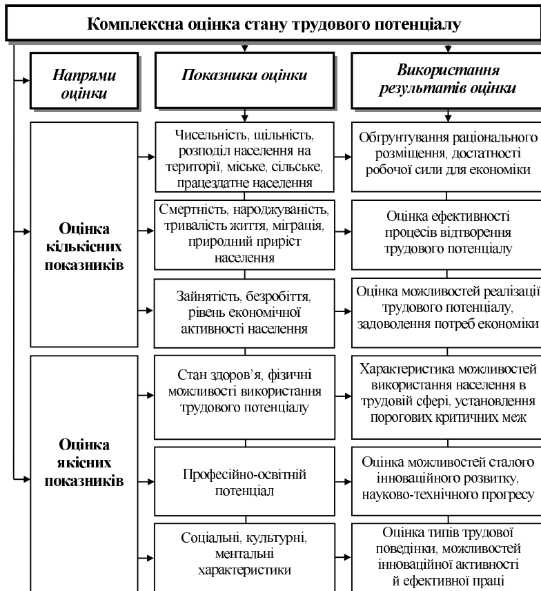
Рис. 4. Структура комплексної оцінки стану трудового потенціалу та напрямів її використання

значна диференціація зареєстрованого безробіття в регіонах України, де його рівень коливається від 13,3% у Хмельницькій області до 4,8% у м. Києві.