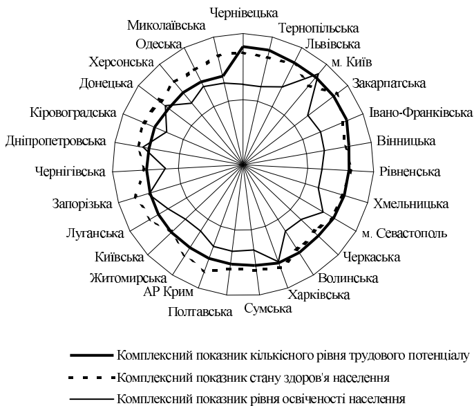
Рис. 2. Оцінка диференціації регіонів України за рівнем трудового потенціалу (ранжування проведено за комплексним показником кількісного рівня трудового потенціалу)