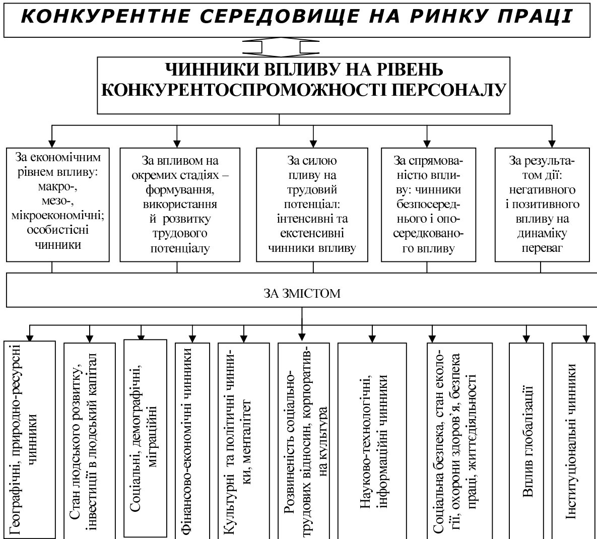
Рис. 1. Класифікація зовнішніх чинників впливу на конкурентоспроможність персоналу

тивного впливу тих чи інших чинників конкурентні переваги працівників стихійно або цілеспрямовано змінюються (нарощуються або зникають), приводячи до багатовекторності процес розвитку конкурентоспроможності персоналу в цілому. Виходячи з такого підходу, підвищення конкурентоспроможності персоналу розглядається в якості результуючої суми векторів від дії сукупності внутрішніх чинників (на рівні особистості) і зовнішніх чинників (поза межами індивіда).